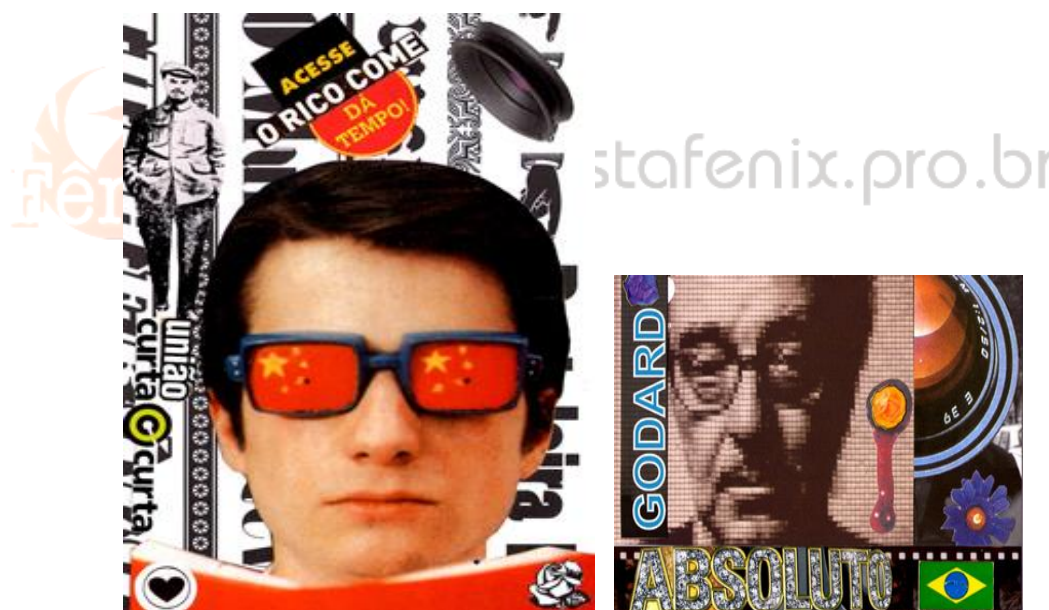
Colagens – Luiz Rosemberg Filho

O diálogo com Godard pode ser avaliado no artigo em que o cineasta discute o filme A Chinesa (1967). Segundo o autor, o cinema de invenção, é, por definição, uma projeção de dúvidas e encantamentos vividos no erotismo e na paixão. 17