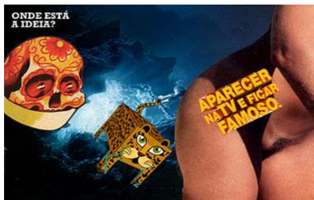
Colagens Luiz Rosemberg Filho

As colagens e o cinema de Luiz Rosemberg Filho parecem ter como base a montagem das atrações, conceito criado pelo cineasta russo Serguei Eisenstein (1898-