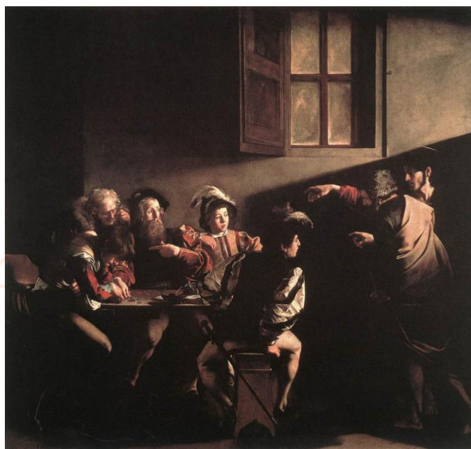
Figura. 1: Vocação de São Mateus

Esta arte, que é extremamente dramática, busca sempre explorar o ápice, o momento crucial para o desenrolar de um determinado acontecimento. É como se, ao observar a cena da Vocação de São Mateus (fig.1) , o espectador se desse conta que até aquele momento existia um homem que recebe, no exato instante fixado pela obra, o chamamento de Cristo e que, a partir daí, este homem não mais poderá ser o mesmo. Assim, cristaliza-se na tela o auge de um episódio, ainda que se tenha aspectos narrativos do antes e do depois a serem relevados.