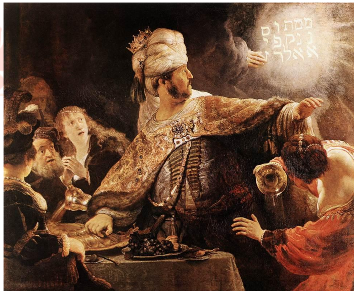
Figura 3: O Festim de Baltasar

No mesmo ano, datada, não sem certa dúvida, surge uma das telas mais impressionantes e comentadas de autoria do mestre holandês: O Festim de Baltasar (fig.3) , uma obra realizada a óleo sobre tela e, como a anterior, de grandes dimensões (167 X 209), que se encontra, desde 1964, na National Gallery , de Londres.