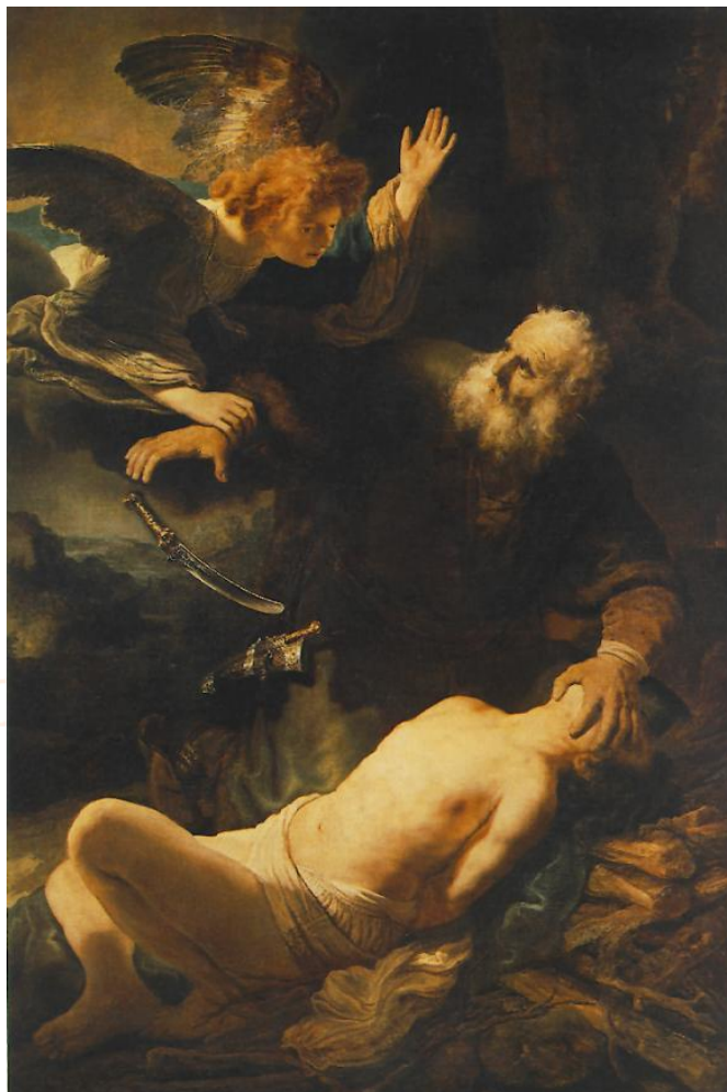
Figura 2: O Anjo impede Abraão de sacrificar seu filho Isaac

característica pode ser exemplificada com a análise da grande tela (193 X 132) O Anjo impede Abraão de sacrificar seu filho Isaac (fig.2) , de 1635, atualmente no Museu Ermitage, em São Petersburgo. Curiosamente, também Caravaggio, aproximadamente quarenta anos antes, havia dedicado duas telas ao mesmo tema, uma de 1596, hoje pertencente à coleção de Barbara Piasecka Johnson, e outra, de 1603, exposta atualmente na Galeria Uffizi, em Florença.