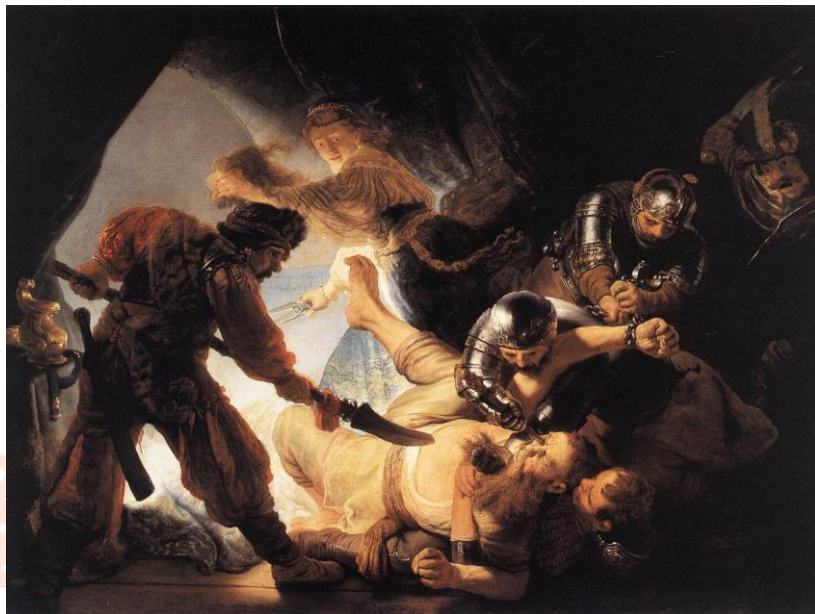
Figura 4: Sansão cego pelos filisteus

Momentos de extrema tensão e expressão máxima de movimento, temos também na nossa próxima obra, Sansão cego pelos filisteus (fig. 4) , de 1636, também um óleo sobre tela de grande dimensão, 206 X 276, exposta atualmente na cidade de Frankfurt.