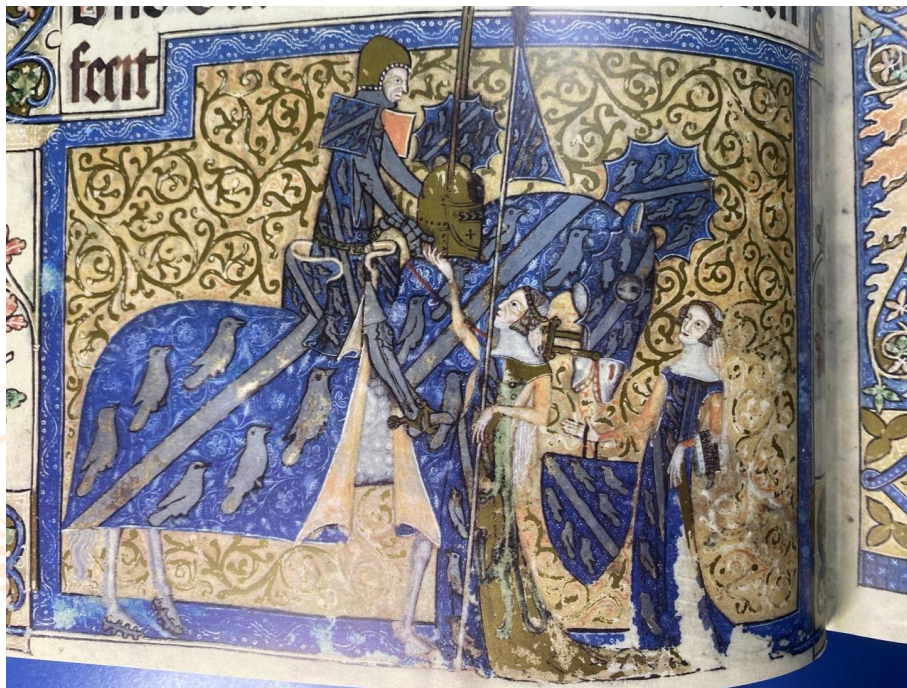
Figura 1. Sir Geoffrey Luttrell armado pelas mulheres de sua família