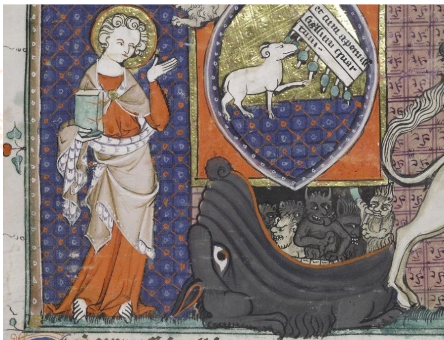
Figura 4. Demônios saindo da Boca do Inferno