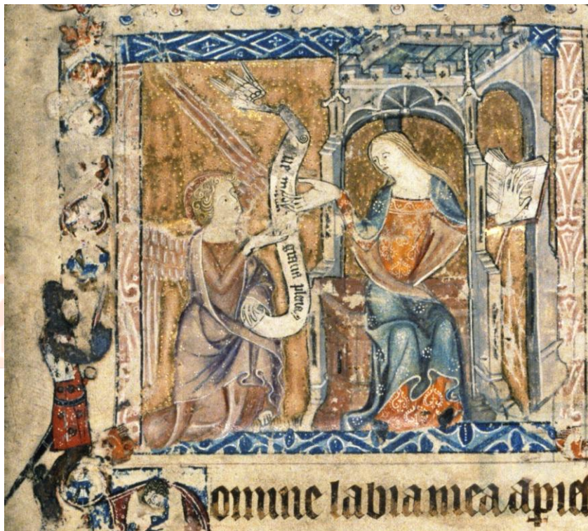
Figura 2. Cavaleiro em oração perante miniatura da Anunciação