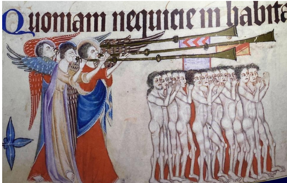
Figura 5. Juízo Final