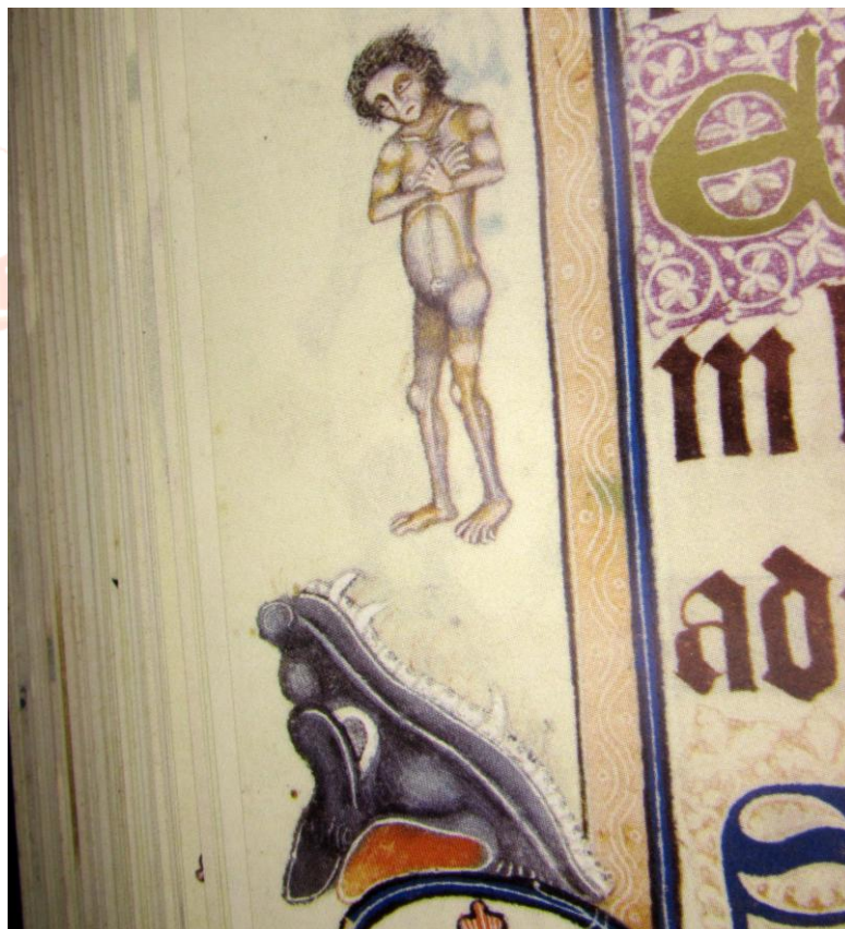
Figura 3. Boca do Inferno e alma condenada